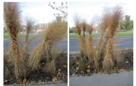
Tańczące chochoły przy ulicy Nowosądeckiej. Fot. (Kaj)

to niebezpieczna dla Polaków pora... (parafraza z „Nocy Listopadowej” St. Wyspiańskiego).