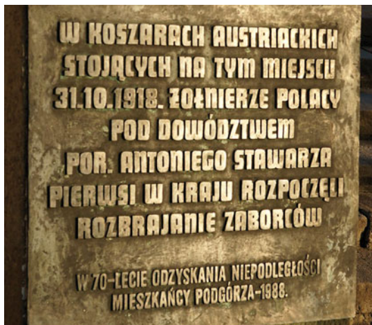
Tablica na pl. Niepodległości upamiętniająca 70-lecie odzyskania Niepodległości, ufundowana przez mieszkańców Podgórze w 1988 r.

W tym samym czasie opanowane zostały koszary drugiego batalionu asystencyjnego przy ul. Wielickiej. Dokonał tego ppor. Pustelnik, por. Hustek (z pochodzenia Słowak) i lwowianin por. Iwaszko. Podgórze jest w polskich rękach. Jest 31 października 1918 r. W Rynku Podgórskim na ulicy Kalwaryjskiej i Limanowskiego odbywa się wiec z udziałem ludności.