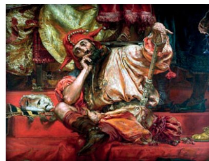
Quo vadis, Poloniae?

Frekwencja wyniosła 44 proc., tak więc nie uzyskano wymaganej większości.